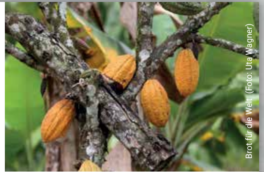
Brot für die Welt

Für substantielle Verbesserungen bedarf es aber unbedingt auch einer Weichenstellung durch die lokale wie internationale Politik. Und es bedarf der Verbraucher, die sich einmischen. Die Inkota-Kampagne 2015 „Make Chocolate Fair!“, die über 122.000 Menschen unterstützten, machte auch bei der Süßwarenindustrie Eindruck. Ob sie ihr Versprechen, Kinderarbeit zu bekämpfen und bessere Preise zu zahlen hält, bleibt abzuwarten. (up)